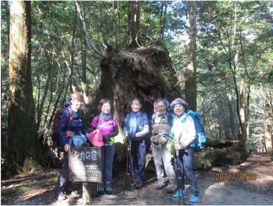
白谷雲水峡鹿の宿